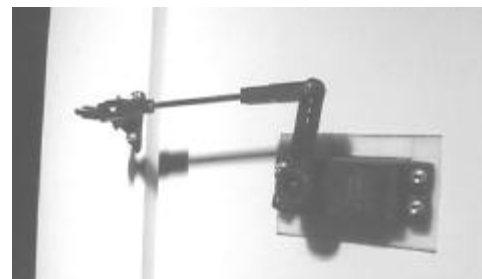
FIGURA 1 – servo do aileron